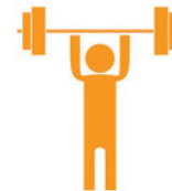
Tập thể dục