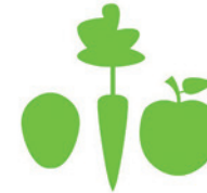
Thực ăn lành mạnh